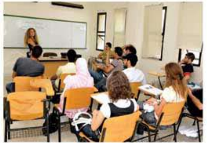
اشتهروا به من تمكن لغوي وثقافي ، وتتعهد مجالات العمل في الترجمة بتعدد النشر عالمية على المترجمين اللبنانيين لما

التعليم هو الوسيلة الأمثل لإحداث التغيير المنشود في المجتمع ولهذا صدر القانون الذي حصر رسالة التعليم بمن يحملون شهادة بكالوريوس .